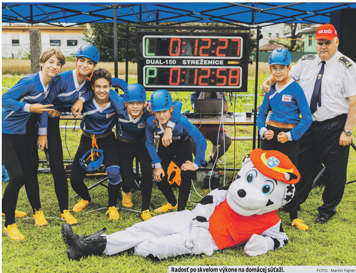
Radost po skvelom výkone na domácej súťaži.