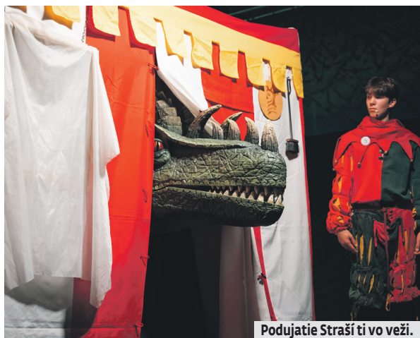
Podujatie „Straší ti vo veži.“