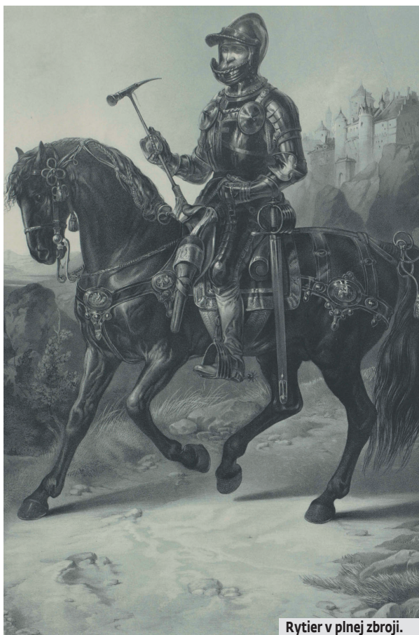
Rytier v plnej zbroji.