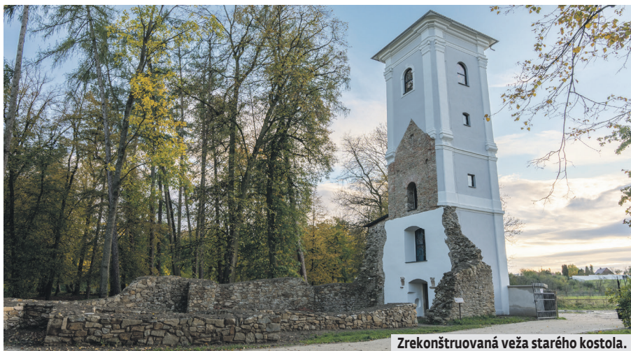
Zrekonštruovaná veža starého kostola.