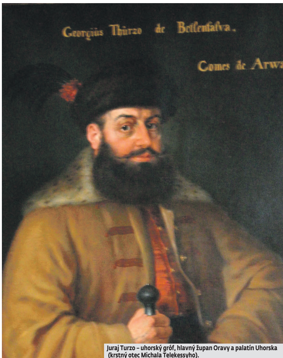
Juraj Turzo – uhorský gróf, hlavný župan Oravy a palatín Uhorska (krstný otec Michala Telekessyho).