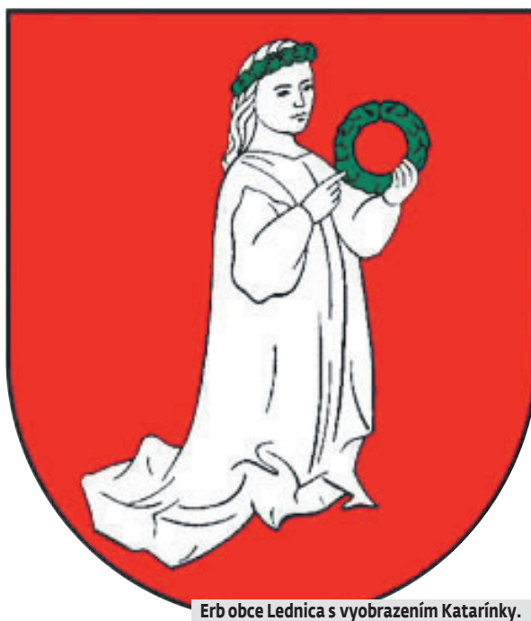
Erb obce Lednica s vyobrazením Katarínky.