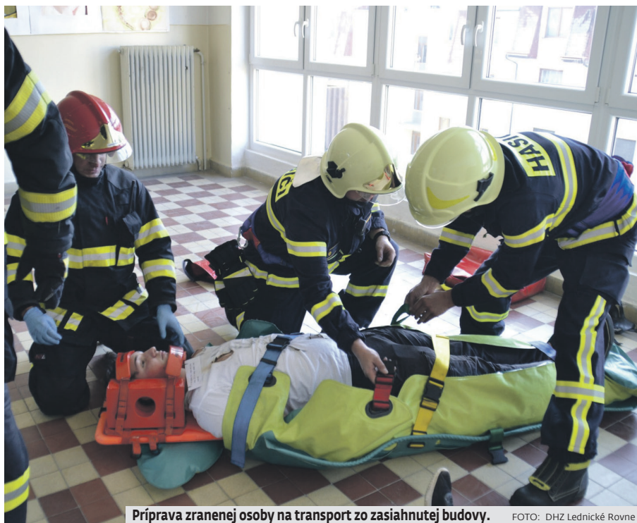
Príprava zranenej osoby na transport zo zasiahnutej budovy.

Novým pracovným stolom a potrebným náradím sme zase vybavili dielňu hasičskej zbrojnice. Počas priaznivého počasia, keď to vonkajšie teploty dovolili, naši členovia takisto pracovali na