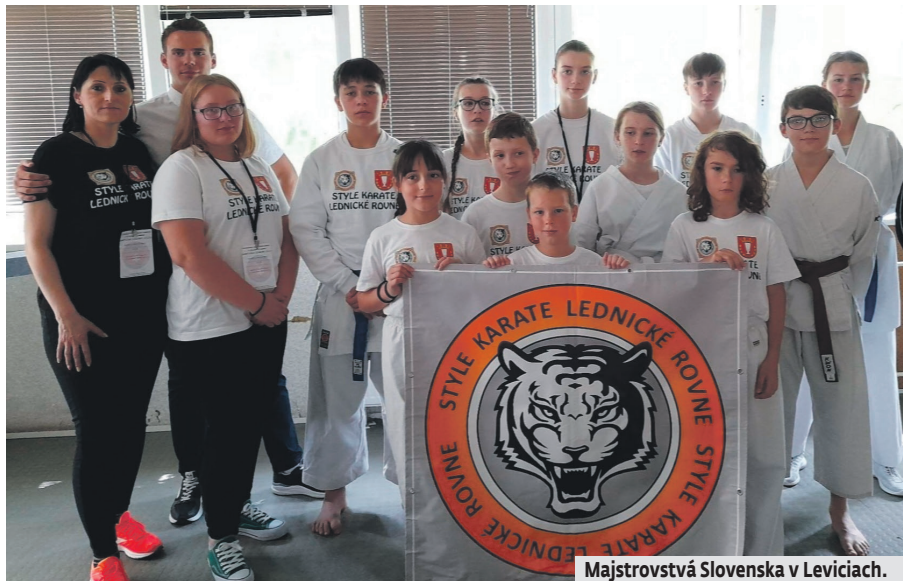
Majstrovstvá Slovenska v Leviciach.

V dňoch 6. - 11. 8. 2023 sa konalo sústrezenie - camp na Vršatci pre členov, detí a pretekárov STYLE KARATE LEDNICKÉ ROVNE. Zúčastnilo sa 65 členov klubu, kde sa pripravovali na jesennú sezónu. Trénovalo sa trikrát