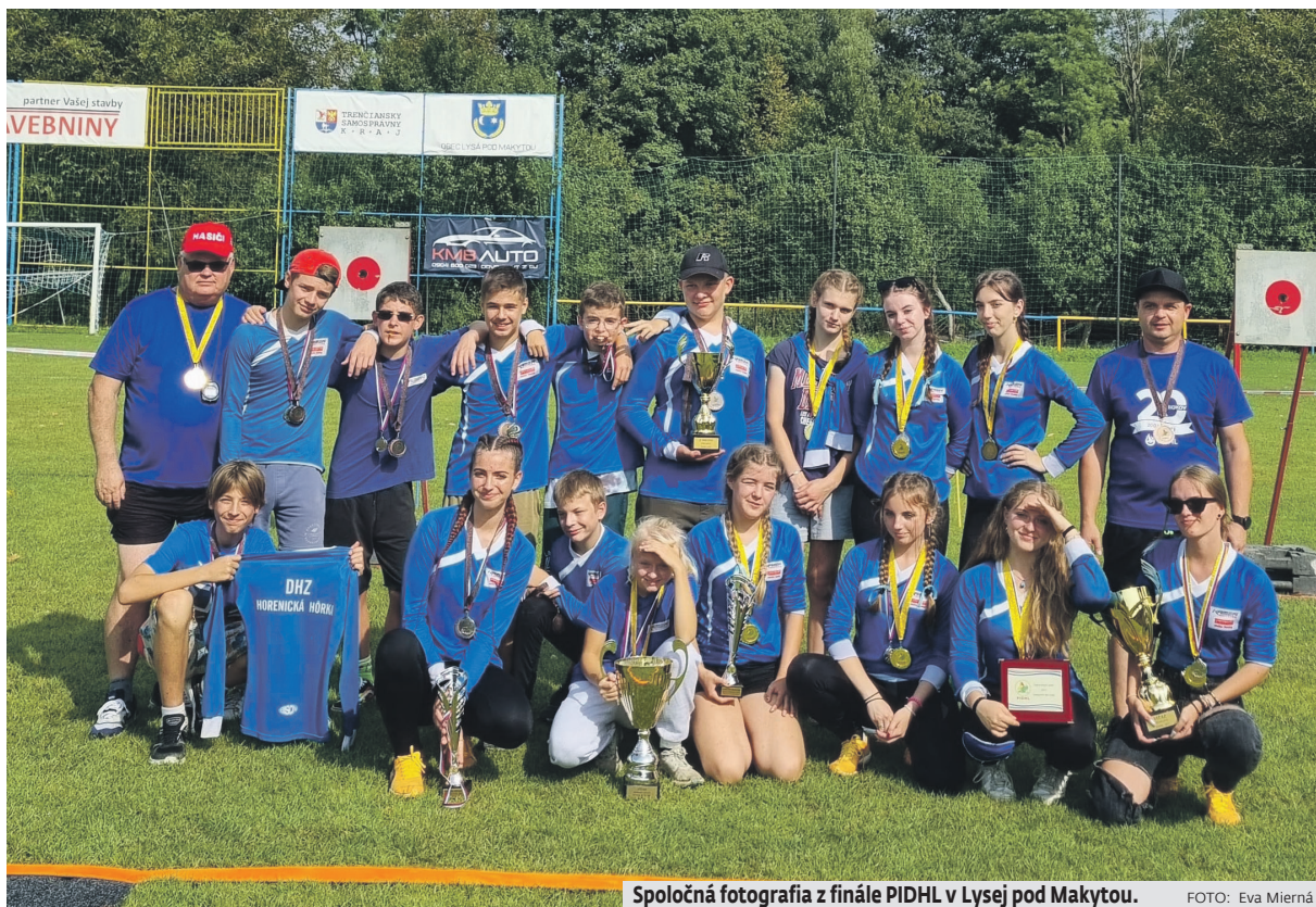
Spoločná fotografia z finále PIDHL v Lysej pod Makytou.