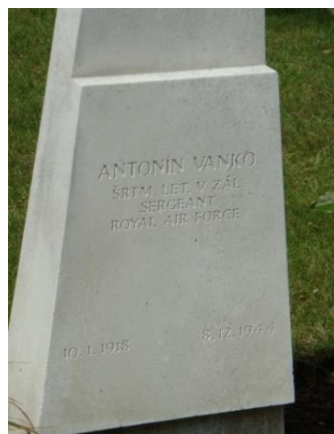
Z. Peer, august 2017